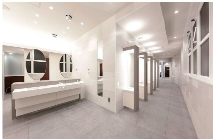
女性トイレ 洗面コーナー

今回のトイレ改修は、「バリアフリー設備の拡充および機能分散」「あらゆるニーズに対応」「明るくて清潔感のあるトイレ」の3つのポイントを軸に実施。それにより、ブース内の設備内容を変えた2ヶ所のバリアフリートイレや、エントランスに面した手洗い付きの男女共用トイレを設置。さらに男性・女性トイレ内においても簡易オストメイト機能などを備えて機能を分散している。女性トイレにはスタイリングコーナーが新設された。ラウンド形状のエントランスには、はじめて訪れた方でもひと目でわかる施設の配置が行われ、換気によるトイレ内環境の快適性確保、明るく安心な空間、清掃がしやすい内装材の採用など、多様なお客様のニーズに応える、機能的で快適なトイレに生まれ変わった。