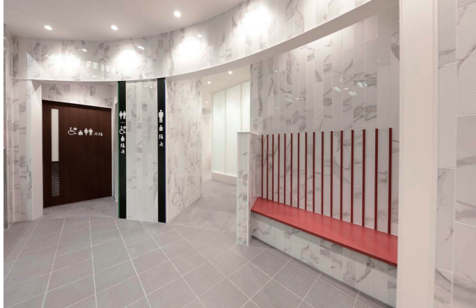
バリアフリートイレ②入口

2ヶ所設置されたバリアフリートイレは、ブース内の設備を変え、機能を分散。バリアフリートイレ①は、車いす利用者などに対応できる設備を完備し、介助時などのプライバシー配慮としてカーテンも設けている。