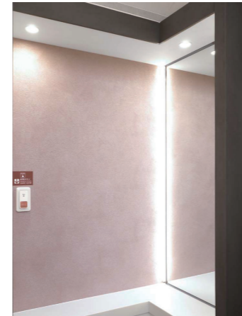
女性トイレ スタイリングコーナー

半個室型のスタイリングコーナーには、各ブースごとに、非常ボタンが設置されており、利用者が安心して使える設備が整えられている。