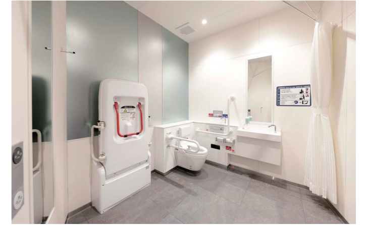
バリアフリートイレ①

直径1800mmの内接スペースを確保したバリアフリートイレ①の入口は、2枚引戸仕様。右側奥に続く通路は、女性トイレの入口となる。