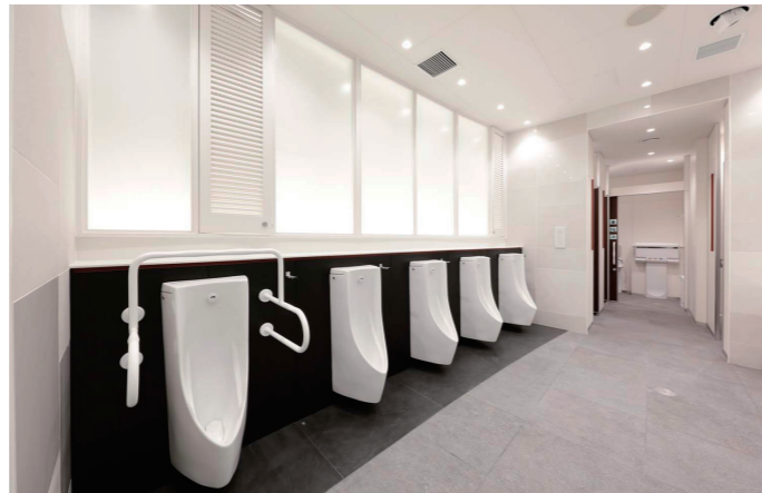
男性トイレ小便器コーナー

男性トイレの洗面コーナーは、2ヶ所に分散配置されている。機能や内装は同様とし、デザイン性を感じさせる衛生感ある空間となっている。