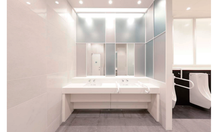
男性トイレ洗面コーナー①

遠くからでも視認性のよいピクトサインを、各トイレ入口に掲示。各バリアフリートイレ入口のピクトサインに「直径1.8m」「直径1.5m」と内接スペースの広さを数値化して掲示している。