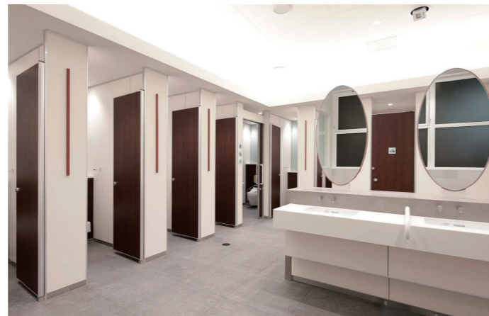
女性トイレ 大便器コーナー

エントランスからスタイリングコーナーを通過して通路を抜けると、アイランド型の洗面コーナーが設置された、開放的なスペースが現れる。