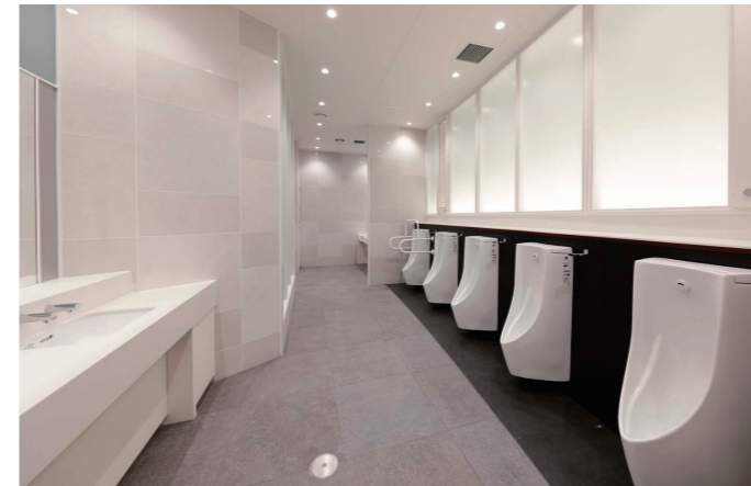
男性トイレ小便器コーナー

さまざまな身体状況の方に配慮して、1ヶ所の小便器に手すりを設置。小便器の後ろは、既存の窓を活かした光壁としており、やわらかい光が気持ちのよい空間となっている。