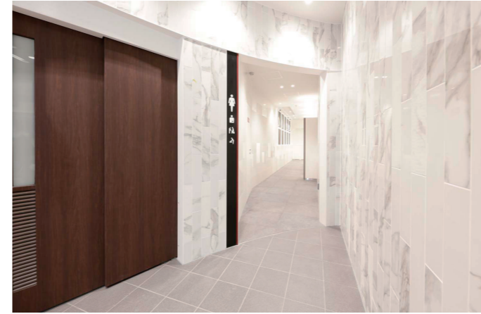
バリアフリートイレ①入口

円形のエントランスを中心に、共用や男性・女性トイレの入口を配置。ラウンドした壁面に照らされた照明が、清潔感にあふれた優美な雰囲気のある内装となっている。