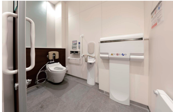
男性トイレ ひろびろブース

男性トイレの1ヶ所にひろびろブースを設置。バリアフリートイレとの機能分散を図るため、オストメイトへ配慮したパウチ・しびん洗浄付背もたれと、フィッティングボードを備えている。