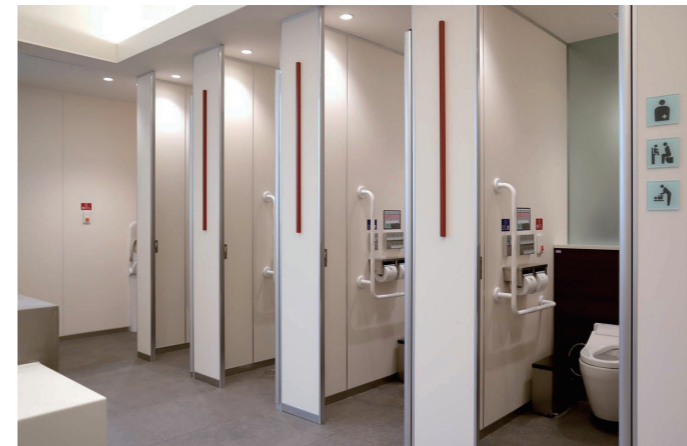
女性トイレ 大便器コーナー

スペースの中央に見渡しのよいアイランド型洗面コーナーを配置し、その周りを囲むように大便器ブースをレイアウト。壁面と扉の色を変え、ブース内の空き状況がひと目で確認できるように配慮されている。