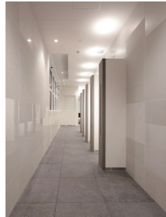
女性トイレ 通路・ スタイリングコーナー

男性トイレの1ヶ所にひろびろブースを設置。バリアフリートイレとの機能分散を図るため、オストメイトへ配慮したパウチ・しびん洗浄付背もたれと、フィッティングボードを備えている。