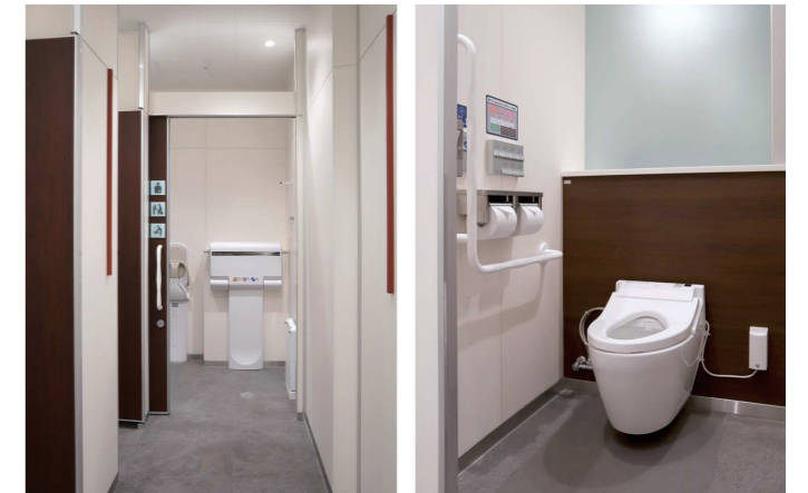
男性トイレ 大便器ブース

小便器コーナーの前板と床をダークな色味で仕上げ、全体の内装とコントラストを際立たせている。また、落ち着いた内装になるよう、間接照明やダウンライトなどの照明計画にもこだわりを感じさせている。