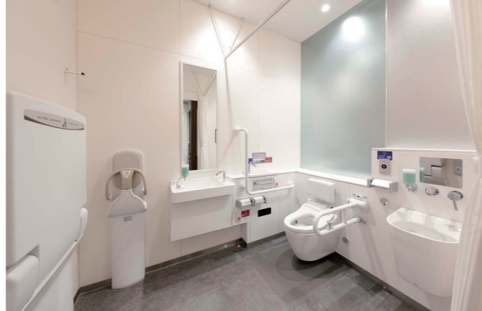
バリアフリートイレ②

エントランスには、待ち合わせや休憩スペースとして、正面にベンチが設置されている。写真奥には、直径1500mmの内接スペースを確保したバリアフリートイレ②と共用トイレの入口が配置されている。