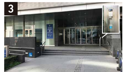
3 入口より建物に入る。(スロープあり) (サポートが必要な場合、入口前にあるインターフォンを押してください。防災センターにつながります。)