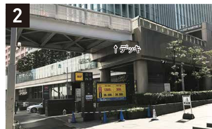
2 デッキをくぐり、右手の建物が「JR南新宿ビル」。(駐車場の出入口があります。車にお気をつけください。)