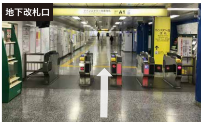
地下改札口 都営新宿・大江戸線・京王新線「新宿マインズタワー」方面改札口より出る。