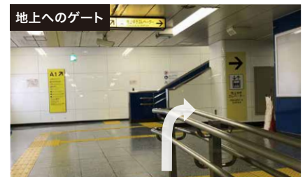
地上へのゲート 階段手前の通路を右に進み、奥のエレベーターを利用して、地上に出る。