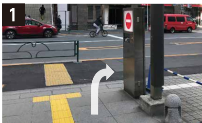
1 地上に出て、右方向に進む。