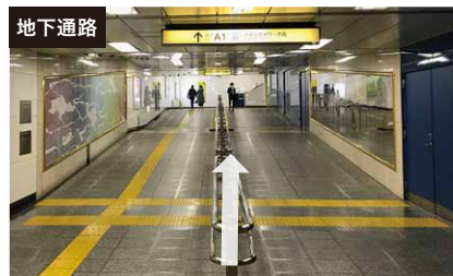
地下通路 都営地下鉄「A1」出口、マインズタワー方面に向かう。(通路は長い上り坂です。)