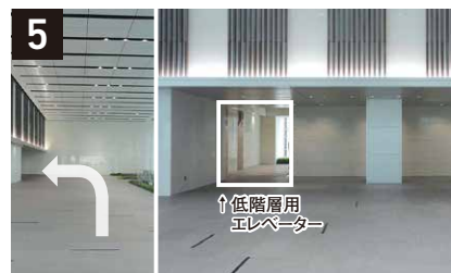
5 2階に上がり、矢印の方向に進む。 (左の低層用エレベーターで6階にお越しください。)