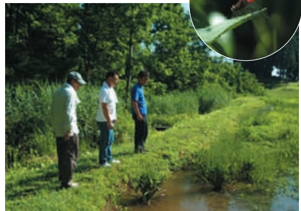
命を育んでいる豊かな水資源の活用も今後の課題である