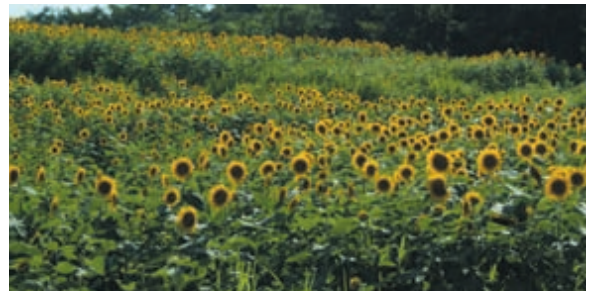
遊休農地に植えられた100万本のひまわりの迫力!