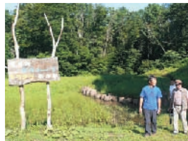
減反している田んぼをビオトープに