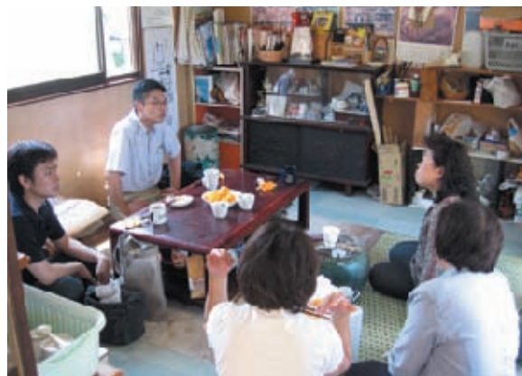
代表とボランティアの女性たちが活動について説明