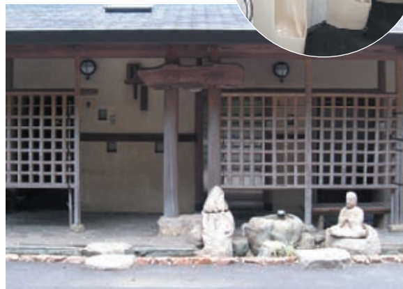
住職が定期的に「えひめAI」を投入しているトイレは臭いがしない