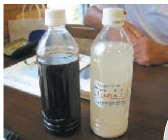
左から「えひめAI-1」(東レ製) 「えひめAI-2」(自家製)