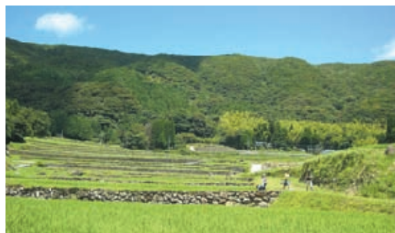
14.7haの八重棚田は水を貯える緑のダムである

甲突川源流ウォークでは、甲突川小浦から甲突池まで川の中を歩き、生物を観察し、途中棚田も見学し、森林インストラクターから山、田んぼ、川、そして海につながる自然環境の関わりを学ぶ。源流を訪ねることで、水に対する思いが深まり、市民ひとり、ひとりが環境保全の意識を持つきっかけになることを期待したい。午後は子ども達が楽しめるよう、木工細工等を行う。甲突川を舞台に市民交流、そして親子のふれあい、心と体の健康作りにつながるようにする。また、八重山集落の方々の指導で麓の畑地でそば植えを体験し、収穫後はそばを打ち、食するなどして、農家の方々との交流も深める。