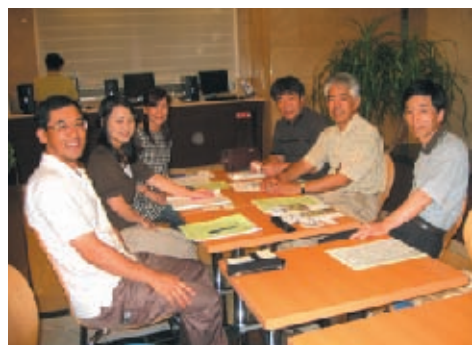
ホテルロビーでヒアリング