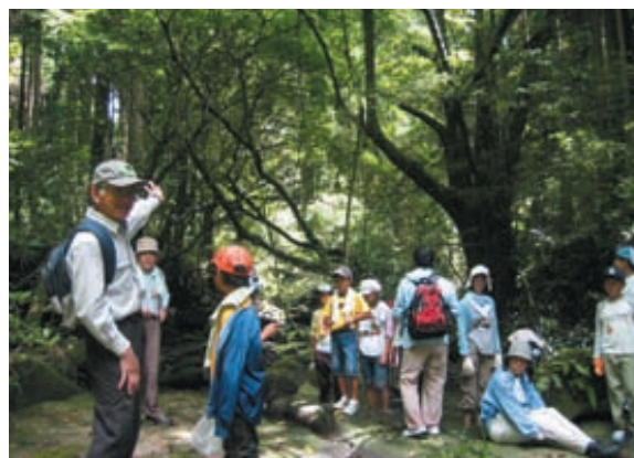
森林インストラクター(左端)の話に耳を傾ける