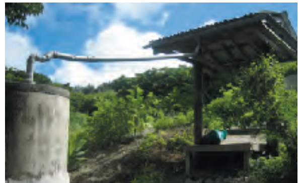
屋根に降った雨水をタンクに集めて活用する