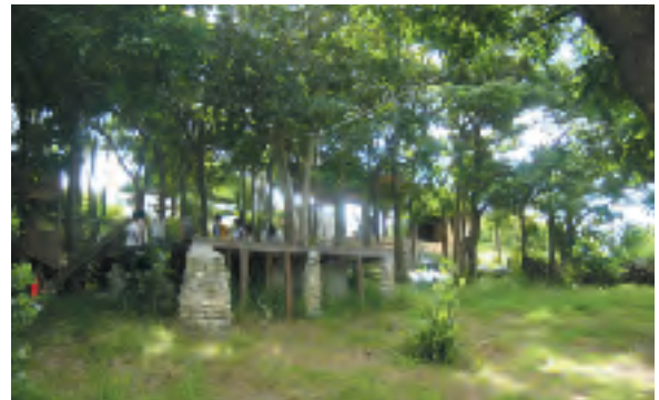
炊事場や水洗トイレなどが完成した山がんまり現地