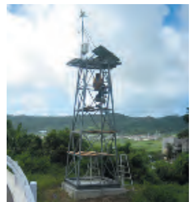
作業は生徒らの手で・ペンキ塗り