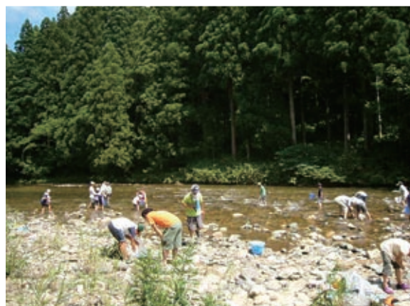
高根川流域での自然観察会。多くの子供たちに経験させたい