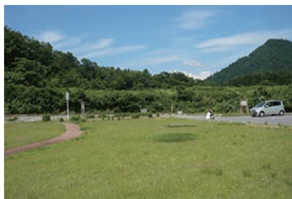
イベントが開催される天蓋高原。大変眺めのよいところだ