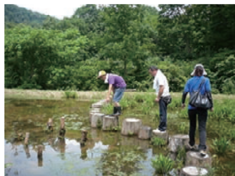
様々な動植物が生息するビオトープ