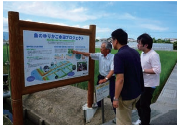
魚のゆりかご水田農法の説明を受ける。将来はブランド米に!