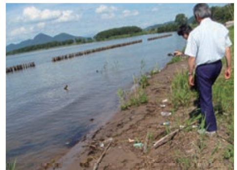
河川から流入したゴミが散乱する琵琶湖湖畔