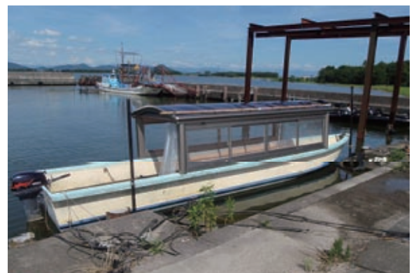
川の自然について船頭さんが説明をするという屋形船