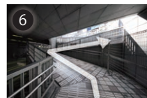
6 ジグザクのスロープを登り切ると、目の前にTOTO 乃木坂ビルがあります