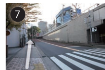
7 道なりに、緩やかな上り坂をのぼってください