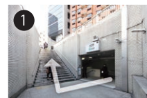
1 3番出口を出て、右手の階段を上ってください