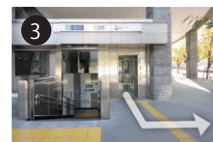
3 2番出口を出て、左に進んでください