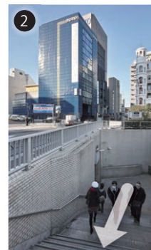
2 階段を上がり切り、振り返ると見える青いビルがTOTO 乃木坂ビルです