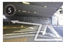
5 渡った先の横断歩道もわたり、左手のスロープを進んでください