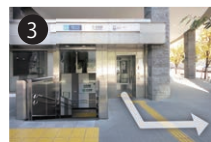
3 2番出口を出て、左に進んでください