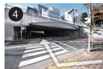
4 すぐ近くの横断歩道を渡ります