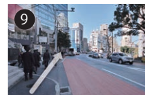
9 横断歩道をわたって右手に進んで行くと、TOTO 乃木坂ビルが見えてきます

【ご注意】乃木坂駅の5番出口（青山霊園・青山葬祭場）、6番出口（国立新美術館）からは、たいへん分かりにくい道順となります。駅員にお声がけいただき、乃木坂駅ホームを経由の上、3番出口をご利用下さい。