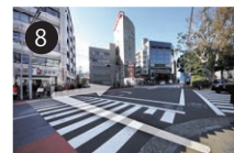
8 坂をのぼり切った交差点で、大きな道（外苑東通り）をわたってください